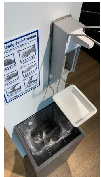
Abb. zeigt tlw. optionales Zubehör (Spender kann frei positioniert werden) und dienen als Referenz

Handelsverbänden und Handelsketten ist es möglich mit der Hygienestation ENTRANCE MM1 sämtliche Verbandsmitglieder kurzfristig mit auszustatten. Aufgrund der hohen Nachfrage werden Sammelbestellungen empfohlen. Die Bestellung von einzelnen Hygienestationen ist mit einer entsprechenden Lieferzeit ebenfalls möglich.